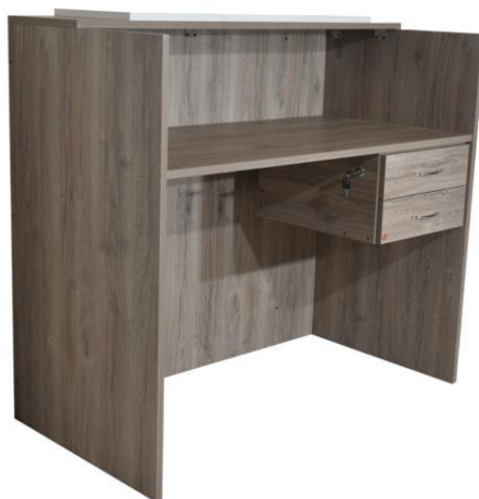
REGLON N° 3