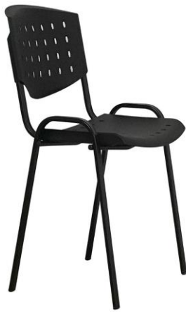
REGLON N° 1