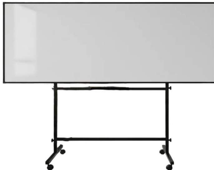
REGLON N° 6