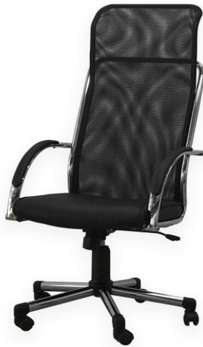
REGLON N° 4