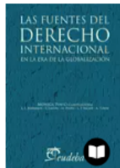
LAS FUENTES DEL DERECHO...