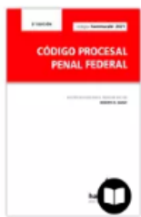
CÓDIGO PROCESAL PENAL FEDERAL 2021