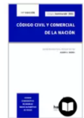
CÓDIGO CIVIL Y COMERCIAL DE LA...