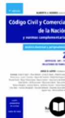
CÓDIGO CIVIL Y COMERCIAL, TOMO 2