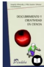
DESCUBRIMIENTO Y CREATIVIDAD EN LA...