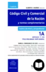
CÓDIGO CIVIL Y COMERCIAL, TOMO 1A