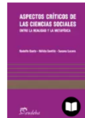
ASPECTOS CRÍTICOS DE LAS CIENCIAS SOCIALES