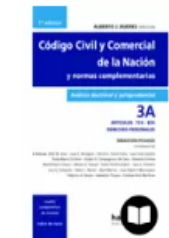
CÓDIGO CIVIL Y COMERCIAL, TOMO 3A

Para más información acerca del recurso escribinos a preferen@derecho.uba.ar