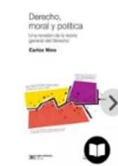
DERECHO, MORAL Y POLITICA