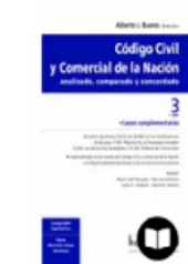
CÓDIGO CIVIL Y COMERCIAL DE LA...